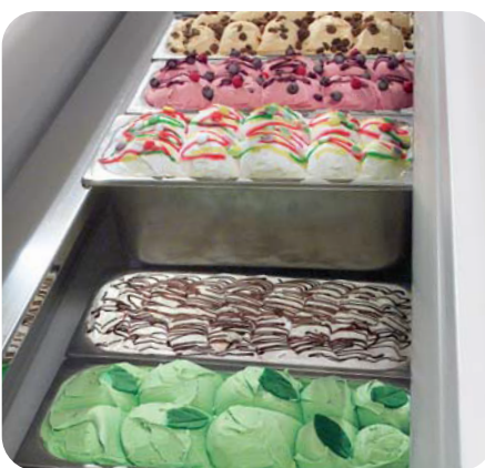
Isabella 10 LX