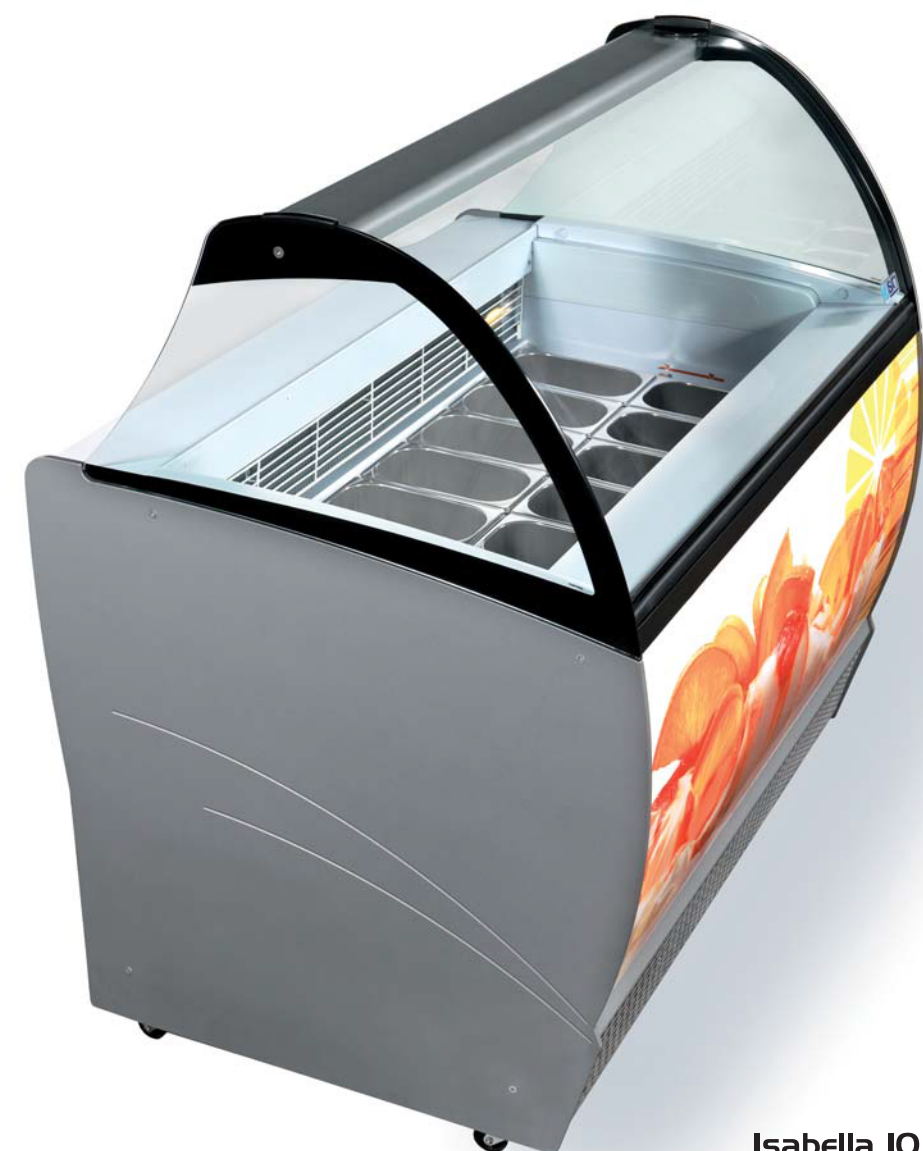
Isabella IO LX